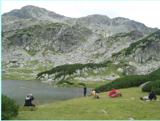
Pauza na jezeru

Ovaj vrh dominira masivom, pa je po njemu dobio ime i Nacionalni park i rezervat. Bilo je pola 3. Nismo se dugo zadržavali, jer je gore počeo da duva jak i prilično hladan vetar. Posle brzog fotografisanja, krenuli smo nazad istim putem.