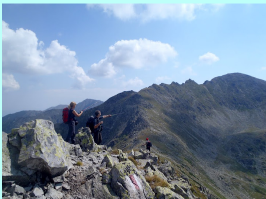
Na prevoju Bukura

Opet je usledilo strmo penjanje do prevoja Bukura (2205 m), odakle smo ugledali veliko, plavo, istoimeno jezero, tako fotogenično za slikanje, okruženo manjim jezercima. Jezero Bukura je jedno od najvećih jezera u ovom masivu, površine od 11 ha. Popeli smo se na vrh Kustura Bukura (2370 m), a zatim preko ogromnog kamenja malo i spustili, da bismo se grebenom uputili ka vrhu Peleaga koji smo već jasno videli ispred nas.