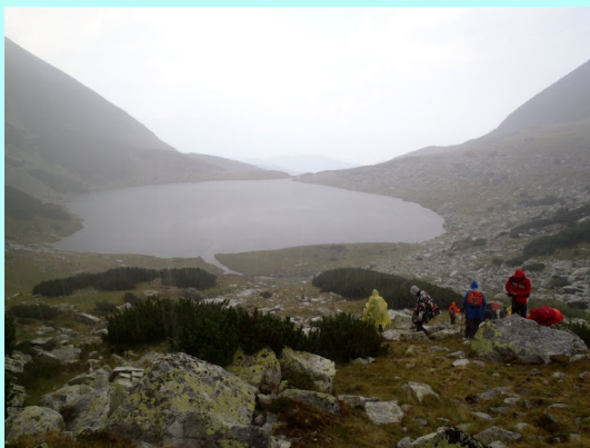
Pljusak na Galeš jezeru

Oko 13 sati, stigli smo na vrh Peleaga (2509 m), koji je i najviši vrh Retezata. Dugo smo sedeli na tom mestu. Nije nas bilo puno. Svi dobro raspoloženi, šalili smo se i smejali.