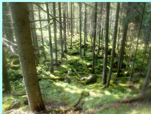
Kao u bajci

A onda, sunce nam se ponovo nasmešilo. Zadovoljno smo posedali na drvene klupe ispred restorana i počastili dobrim, hladnim pivom. Kako je samo prijalo!